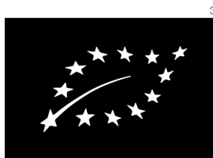
Permitted black and white

EU eko logotip treba koristiti u skladu s registracijom kao zaštitni znak koji se odnosi na ekološku proizvodnju u Uredu za intelektualno vlasništvo Benelux, te u skladu s pravilima zajednice i nacionalnim registrom zaštitnih znakova